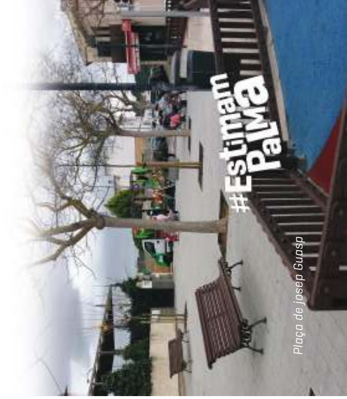
Plaça de Josep Guasp