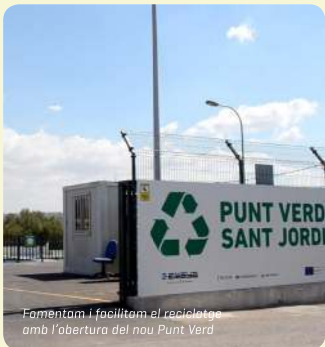
Fomentam i facilitam el reciclatge amb l'obertura del nou Punt Verd