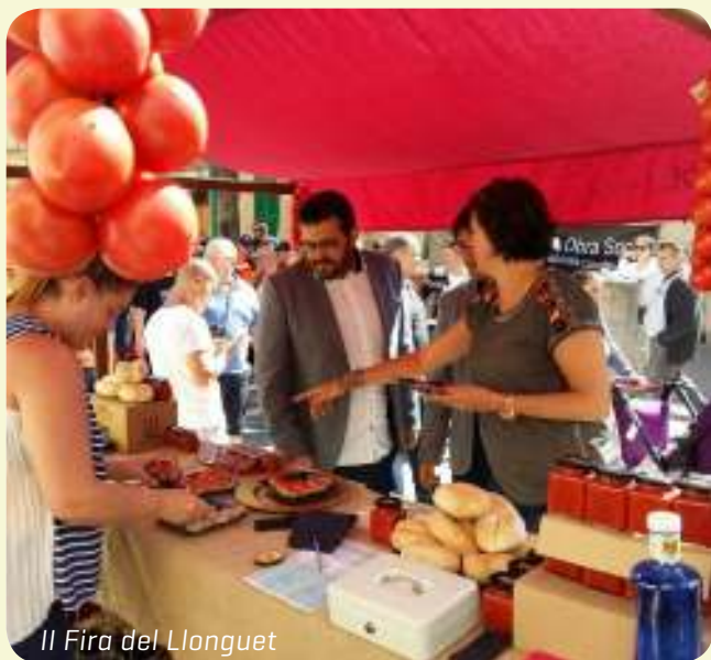
II Fira del Llonguet