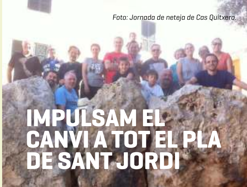
Foto: Jornada de neteja de Cas Quitxero.